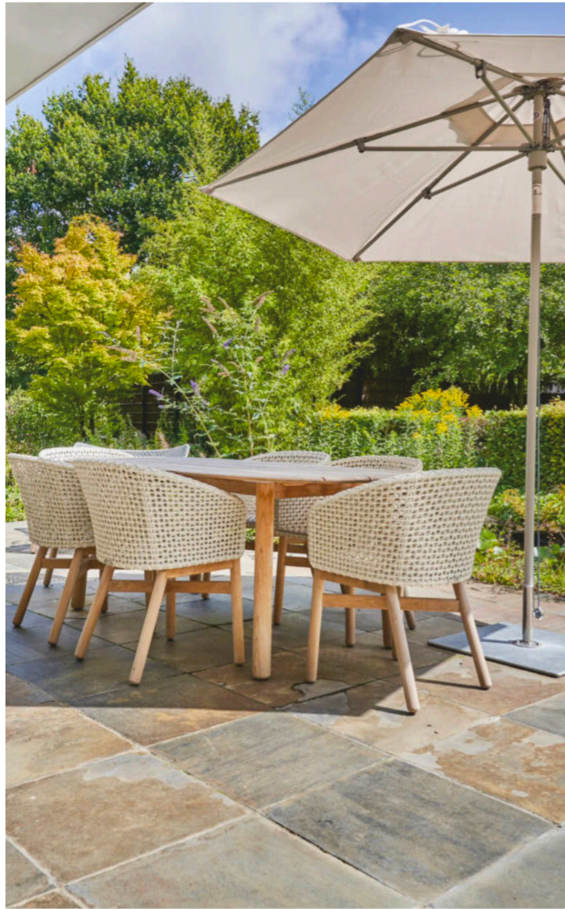
Eettafel en stoelen uit de collectie Mbrace van Dedon.